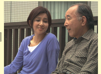
8/11(土)より、シネスイッチ銀座他に全国公開 配給:ファントム・フィルム ©2012「わたし」の人生製作委員会

”タンゴのステップ”が認知症の父と娘の心を再び繋いでいく—実際のエピソードを基に描く、希望と感動の物語。